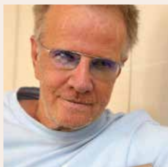
Christophe Lambert Direction d'acteur & Parrain

Véritable touche à tout, Christophe Lambert qu'on ne présente plus s'intéresse depuis longtemps au monde du spectacle musical.